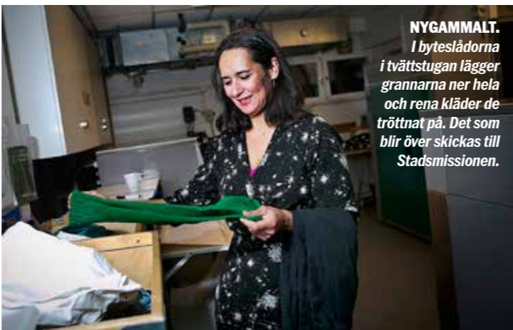
NYGAMMALT. I byteslådan i tvättstugan lägger grannarna ner hela och rena kläder de tröttnat på. Det som blir över skickas till Stadsmissionen.