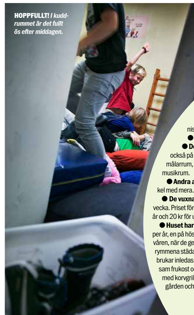
HOPPFULLT! I kuddrummet är det fullt ös efter middagen.

Ett lämmeltåg av barn drar ut i korridoren, svänger bryskt av åt vänster och sedan till höger in i kuddrummet. Kuddkrig följs av klättring i ribbstolarna och en och annan brottningsmatch. Men snart sänker sig lugnet och en bok tas fram och börjar bläddras i. Kompisarna slår sig ner tätt intill och sedan blir det högläsning. ➔