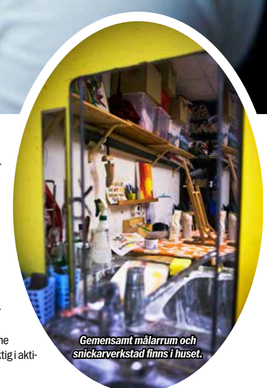
Gemensamt målarrum och snickarverkstad finns i huset.