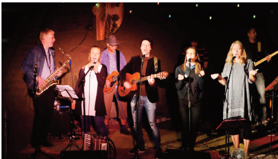
Det eminenta husbandet spelar på den lyckade gårdsfesten i slutet av sommaren.