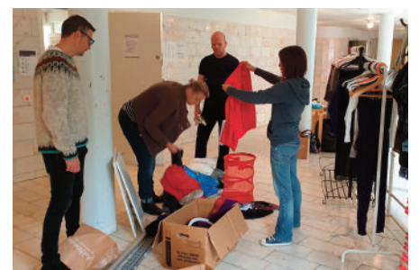
Städdag sista helgen i september och sedan korvgrillning på gården.

Det blir ett digitalt årsmöte 28 mars kl 15:00-16:30. Gå in på https://meet.google.com/wrz-qdyy-gcc